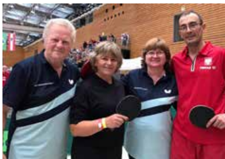
Berlín, smíšená čtyřhra s Poláky, vyhráli jsme, leč kvůli poplachům v hale mimo soutěž

trénovat, pracovat na psychice a pokusit se na příštím mistrovství v Chorvatsku ukázat světu, že hrajeme lepší ping-pong.